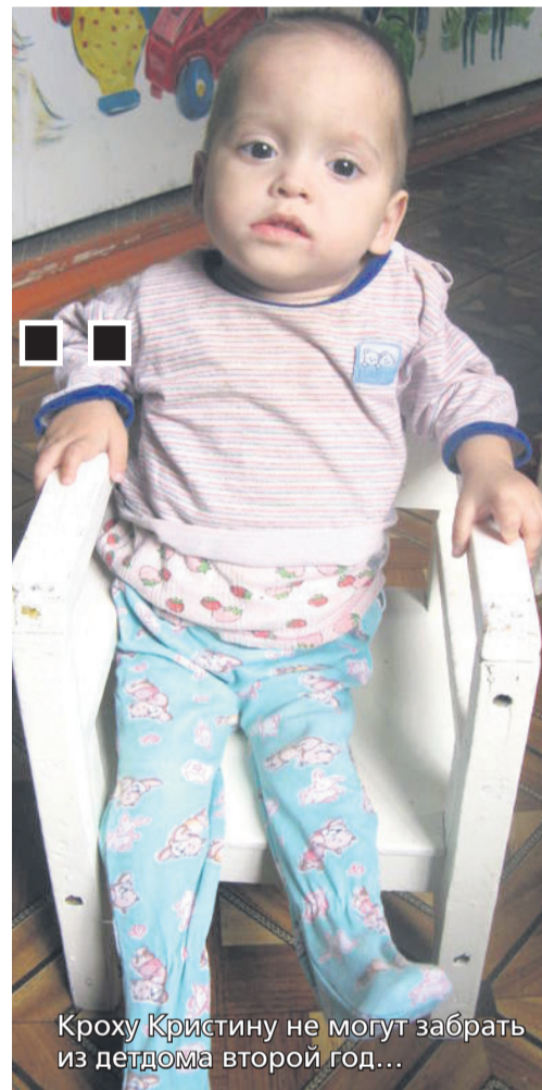
Кроху Крестину не могут забрать из детдома второй год...

Оказывается, просто за «сдачу» детей в детдом родительских прав не лишают. Это отдельная юридическая волокита. Из-за этого дети остаются в детдоме,