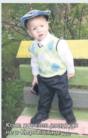
Коле повезло родиться не в Кыргызстане

Скоро Шелби исполнится четыре года. Ее, скорее всего, переведут в детский дом для более взрослых детей. Ее мир станет еще страшнее, чем сейчас, так она окажется самой маленькой и хрупкой среди еще более взрослых детей. Что случится с ней? Кто позаботится о ней? Кому будет повторять «я ву буу»?